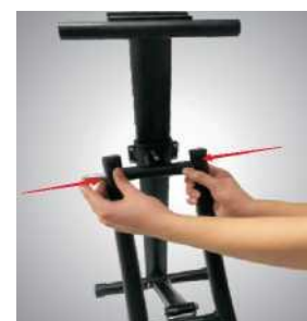
УСТАНОВИТЕ ИЗОГНУТУЮ НАПРАВЛЯЮЩЮЮ В ОСНОВНУЮ РАМУ

Пожалуйста, совместите втулку с отверстием в направляющей, вставьте ось в отверстие и закрутите винт.