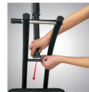
СОЕДИНИТЕЛЬНАЯ ТРУБКА В СБОРЕ

Вставьте конец соединительной трубки в U-образное отверстие, а затем прочно закрепите их.